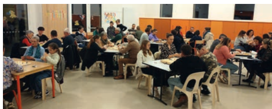
Tournoi de TOC