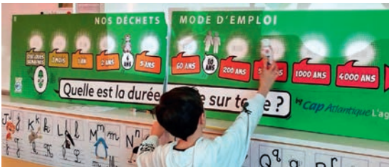
Sensibilisation au tri des déchets