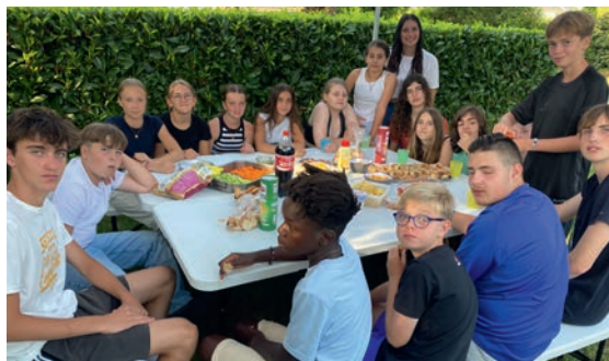
Projet: Island Survivor