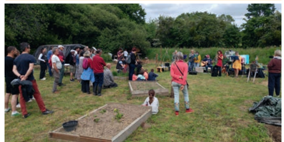
Projet environnement au Jardin Mosaïque