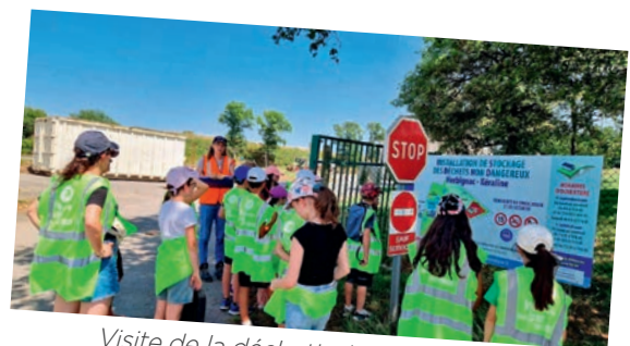
Visite de la déchetterie d'Herbignac