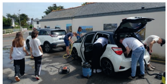
Autofinancement: lavage de voitures