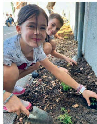
Revégétalisation de la cour