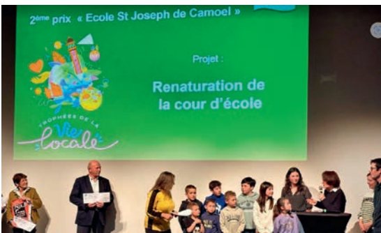
Trophée de la vie locale