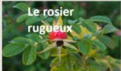
Le rosier rugueux

Les arbustes sont presque dépouillés de leurs feuilles, mais de petits nez rouges peuvent encore attirer le regard. Les baies rouges parfois utilisées pour décorer la bûche de Noël sont nombreuses dans les jardins et les bois. Mais cette utilisation doit rester prudente !